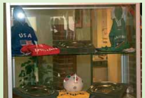
Zu bewundern sind auch die Trikots aller teilnehmenden Nationen der WM.