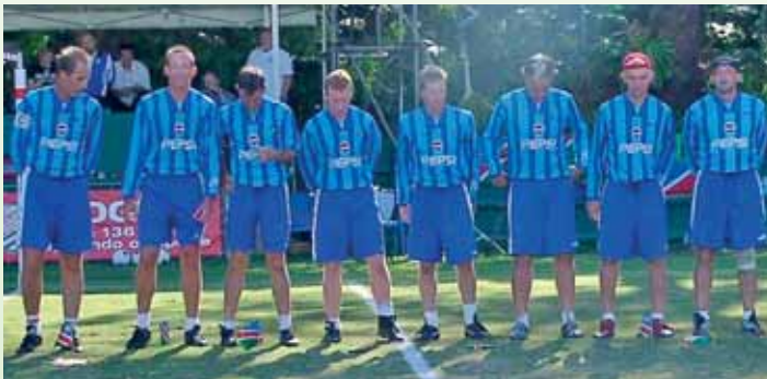
Zurück in der höchsten Weltgruppe: Die Nationalmannschaft Namibias.

Mit dem Besuch der deutschen Nationalmannschaft und einer Stadtmannschaft von Linz/Österreich 1968 im damaligen Südwest-Afrika wurde ein weiteres Bindeglied im internationalen Faustballsport geschaffen. Dabei geht der Beginn des Faustballspiels in Namibia bereits auf das Jahr 1914 zurück: Die Soldaten der deutschen Schutztruppen in Keetmanshoop führten dieses Spiel ein.