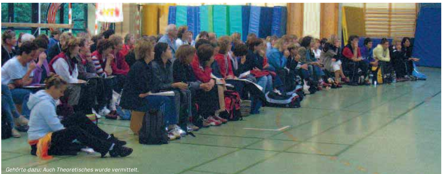
Gehörte dazu: Auch Theoretisches wurde vermittelt.