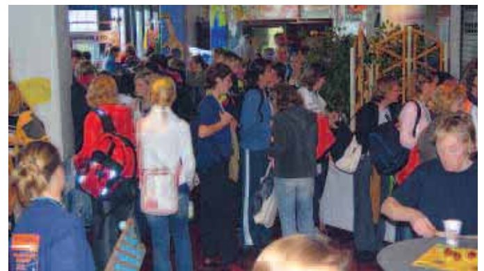
Die Chance zum Stöbern: Die Fachtagungsmesse am Sonnabend wurde rege genutzt.