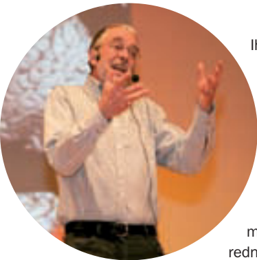
Die Hauptreferate gaben faszinierende Einblicke in spannende Themen.