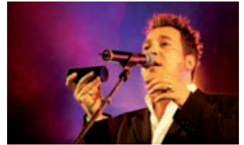
Der Star von heute mit Schmusegarantie: Laith Al-Deen.

Das Programm beginnt bereits am Donnerstag, 08. Mai 2008, wenn sich nach Beendigung des Festaktes zur Eröffnung des 14. Landesturnfestes der Festzug auf dem Altstadtmarkt formiert und durch die Braunschweiger Innenstadt zum Schlossplatz marschiert. Dort wird um 20:00 Uhr die große Eröffnungsfeier stattfinden – und zwar mit filmreifen Attraktionen und natürlich mit viel Musik. Höhepunkt ist der Auftritt der deutschen Erfolgsband „Revolverheld“, die gleich nach dem offiziellen Eröffnungsfest auf dem Schlossplatz rocken wird. In den folgenden Tagen geben sich die Stars