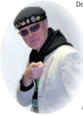
Ein Star von gestern mit Kultcharakter: Harpo.

Sie ist das Herz des Turnfestes und immer wieder die große Attraktion: Auf der Turnfestmeile – in Braunschweig zwischen Altstadtmarkt und Schlossplatz gelegen – pulsiert traditionell das Leben eines Turnfestes, denn sie ist gleichermaßen Treff- und Mittelpunkt aller Turnfestteilnehmer und Gäste.